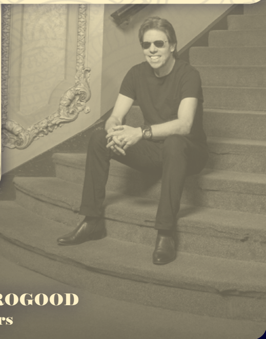
GEORGE THOROGOOD and The Destroyers