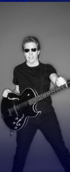
GEORGE THOROGOOD & THE DESTROYERS

C'est le moment où les lumières de la maison s'évanouissent et que le public explose : un battement de tambour dans l'obscurité, et les lumières de la scène, presque aveuglantes au premier abord, révèlent un groupe incroyable prêt à lancer un catalogue de succès. Ce grondement familier d'une slide guitare ouvre le bal, et vous savez que vous êtes sur le point de faire l'expérience de l'icône de « Bad to the Bone » à son meilleur. La formation George Thorogood And The Destroyers lance une fête rock, et vous y êtes invités. D'un océan à l'autre, les critiques sont d'accord : « Je suis heureux de dire, après toutes ces années, que George est toujours Bad To The Bone et qu'il ne lâche jamais le véritable esprit du rock 'n roll! » dit le Daily News de Los Angeles. « Le Thorogood est un revivaliste flamboyant dont l'enthousiasme et le sens du spectacle rendent la musique fraîche », dit le Baltimore Sun. « Il a du charisme et de la personnalité à brûler, un fait qui devient évident au moment où il monte sur scène », dit le Milwaukee Journal Sentinel. L'album « George Thorogood And The Destroyers » sera bientôt certifié or. Au cours de 16 albums studio, dont six disques d'or et deux disques platine sur les maisons de disque Rounder, EMI et Capitol, le groupe rassemblera un catalogue inégalé de succès qui comprend « Who Do You Love », « I Drink Alone », « One Bourbon, One Scotch, One Beer », « Move It On Over », « Get A Haircut » ainsi que le fameux succès « Bad To The Bone ».