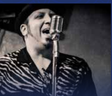
RIOT AND THE BLUES DEVILS

Le légendaire compositeur et guitariste canadien originaire de Winnipeg est le membre fondateur des groupes rock des années 60 The Guess Who (qui s'appelait au départ Chad Allan & The Expressions) et des années 70 Bachman-Turner Overdrive. Son lègue musical est immense, que l'on pense à des immortelles comme « American Woman », « These Eyes », « No Time » et « Share The Land » avec The Guess Who et de « You Ain't Seen Nothing Yet », « Taking Care Of Business », « Hey You », « Roll On Down The Highway » et « Looking Out For Number One » avec Fred Turner et son frère Robbie, ces chansons sont toutes des classiques du rock. Ce n'est pas pour rien qu'il a fait une apparition remarquée dans un épisode des Simpsons en 2003! Au fil des ans, l'Officier de l'Ordre du Canada (2008) et animateur de l'émission Vinyl Tap sur CBC Radio One a aussi enregistré quinze albums solos démontrant sa grande polyvalence dans tous les registres et son amour du jazz et des Beatles. À 74 ans, l'illustre musicien nous fait l'honneur de son immense présence au festival. Au programme, un feu d'artifice de grands succès radio qui ont bercé notre jeunesse et quelques clins d'œil musicaux qui raviront le public présent à ce concert-événement.