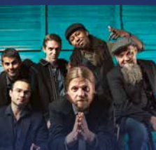
GHOST TOWN BLUES BAND

C'est le moment où les lumières de la maison s'évanouissent et que le public explose : un battement de tambour dans l'obscurité, et les lumières de la scène, presque aveuglantes au premier abord, révèlent un groupe incroyable prêt à lancer un catalogue de succès. Ce grondement familier d'une slide guitare ouvre le bal, et vous savez que vous êtes sur le point de faire l'expérience de l'icône de « Bad to the Bone » à son meilleur. La formation George Thorogood And The Destroyers lance une fête rock, et vous y êtes invités. D'un océan à l'autre, les critiques sont d'accord : « Je suis heureux de dire, après toutes ces années, que George est toujours Bad To The Bone et qu'il ne lâche jamais le véritable esprit du rock 'n roll! » dit le Daily News de Los Angeles. « Le Thorogood est un revivaliste flamboyant dont l'enthousiasme et le sens du spectacle rendent la musique fraîche », dit le Baltimore Sun. « Il a du charisme et de la personnalité à brûler, un fait qui devient évident au moment où il monte sur scène », dit le Milwaukee Journal Sentinel. L'album « George Thorogood And The Destroyers » sera bientôt certifié or. Au cours de 16 albums studio, dont six disques d'or et deux disques platine sur les maisons de disque Rounder, EMI et Capitol, le groupe rassemblera un catalogue inégalé de succès qui comprend « Who Do You Love », « I Drink Alone », « One Bourbon, One Scotch, One Beer », « Move It On Over », « Get A Haircut » ainsi que le fameux succès « Bad To The Bone ».